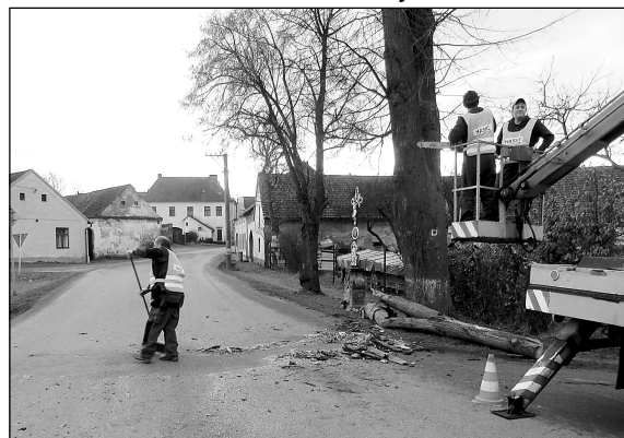
Členové JSDHO při zásahu - ořez lípy a kaštanu